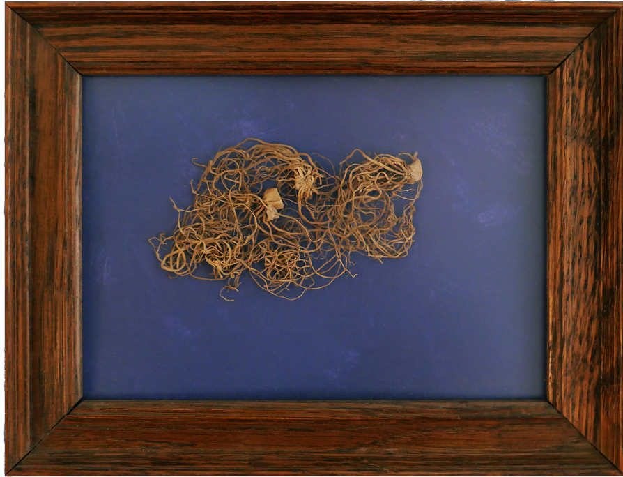
El paisaje de la Metáfora (obra curatorial) objeto, 2022, 16x21 cm.

The Landscape of Metaphora (curatorial work) object, 2022, 16x21 cm.