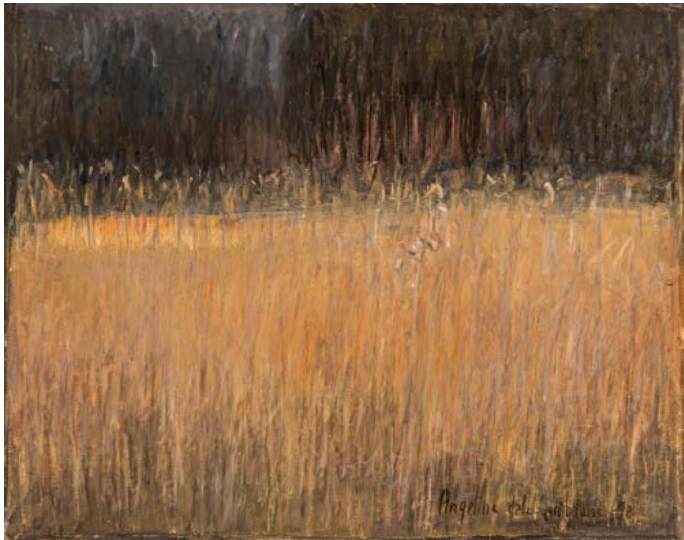
Pastizal de trigo Óleo sobre tela 30x40 cm