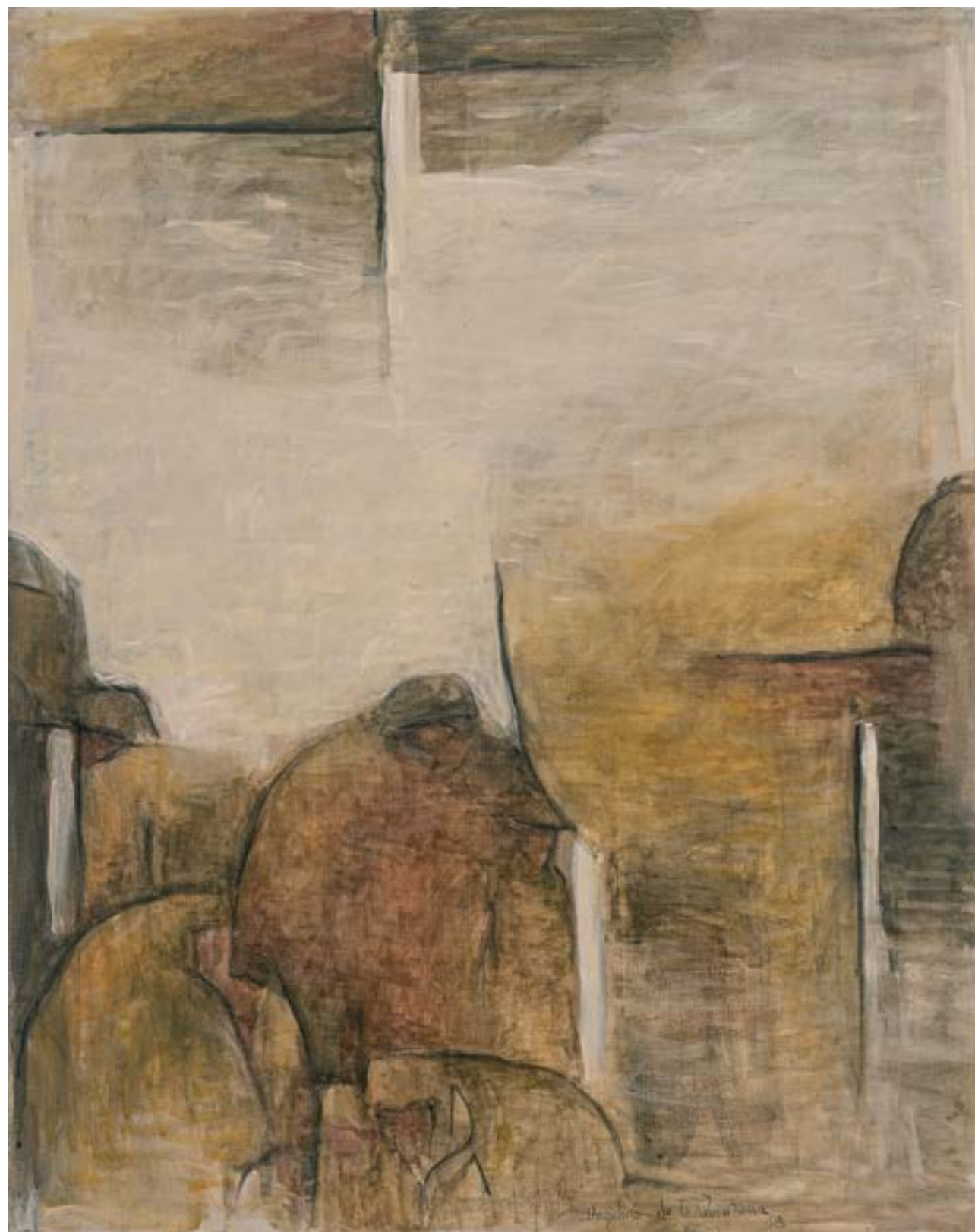
Homenaje a Barradas II Óleo sobre tela 100x80 cm