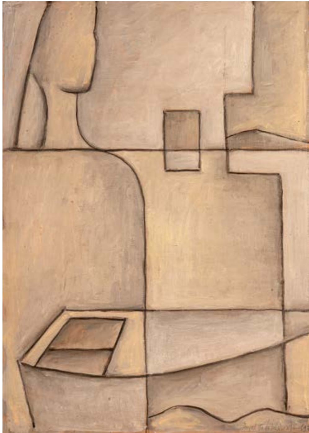
Figura y barca (mujer mirando al cerro) Óleo sobre papel 70x50 cm