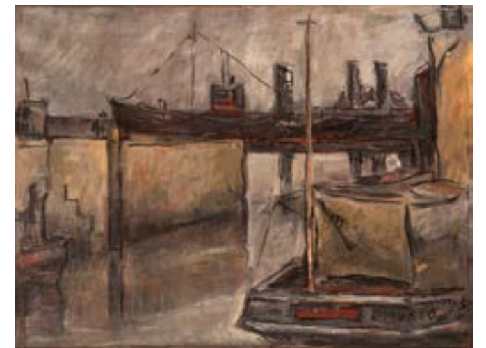
El vapor de la carrera Óleo sobre tela 40x80 cm