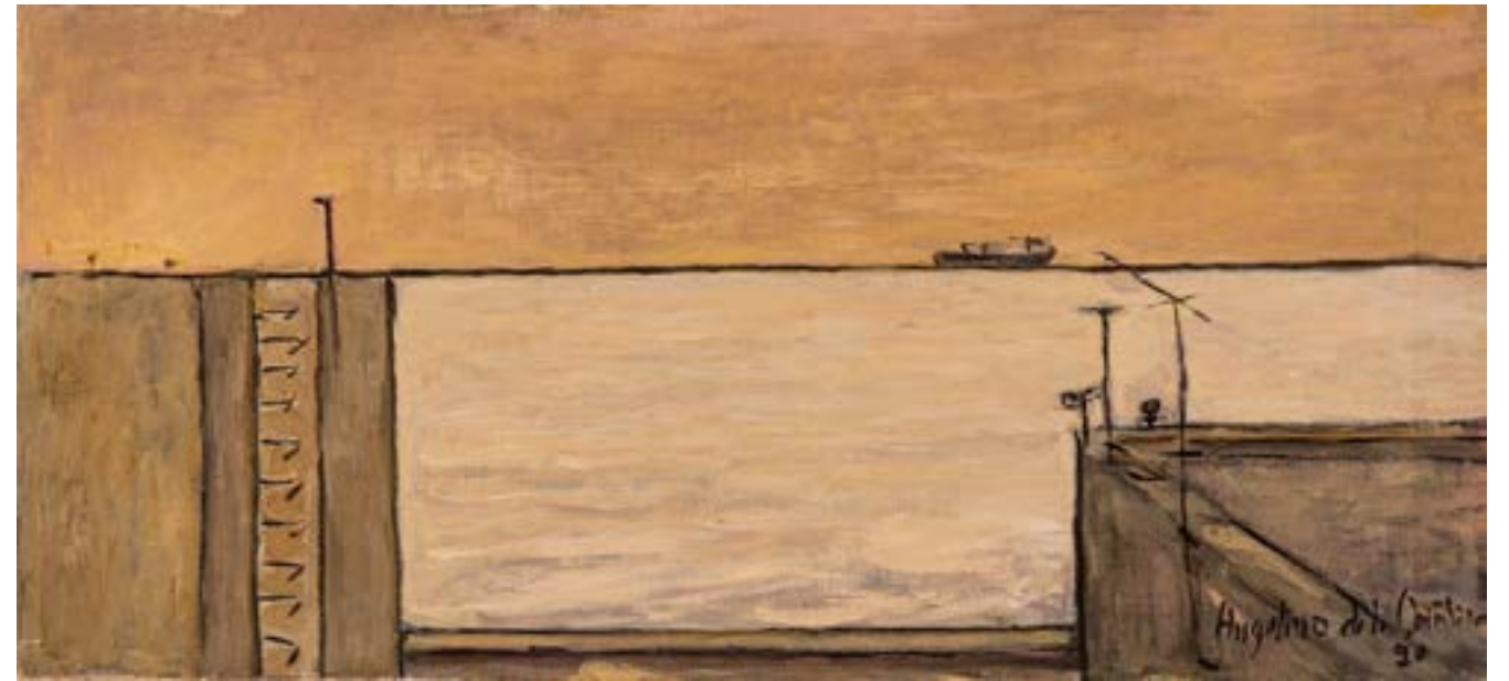
Barco en horizonte Óleo sobre tela 32x70 cm