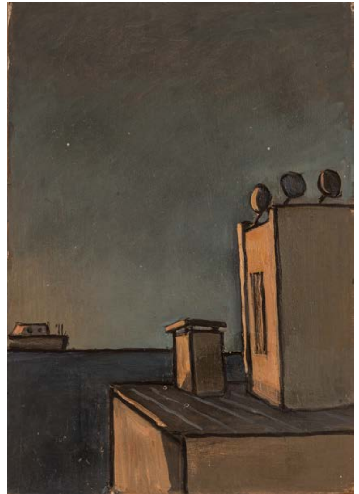
Azontea Óleo sobre cartón 50x35 cm