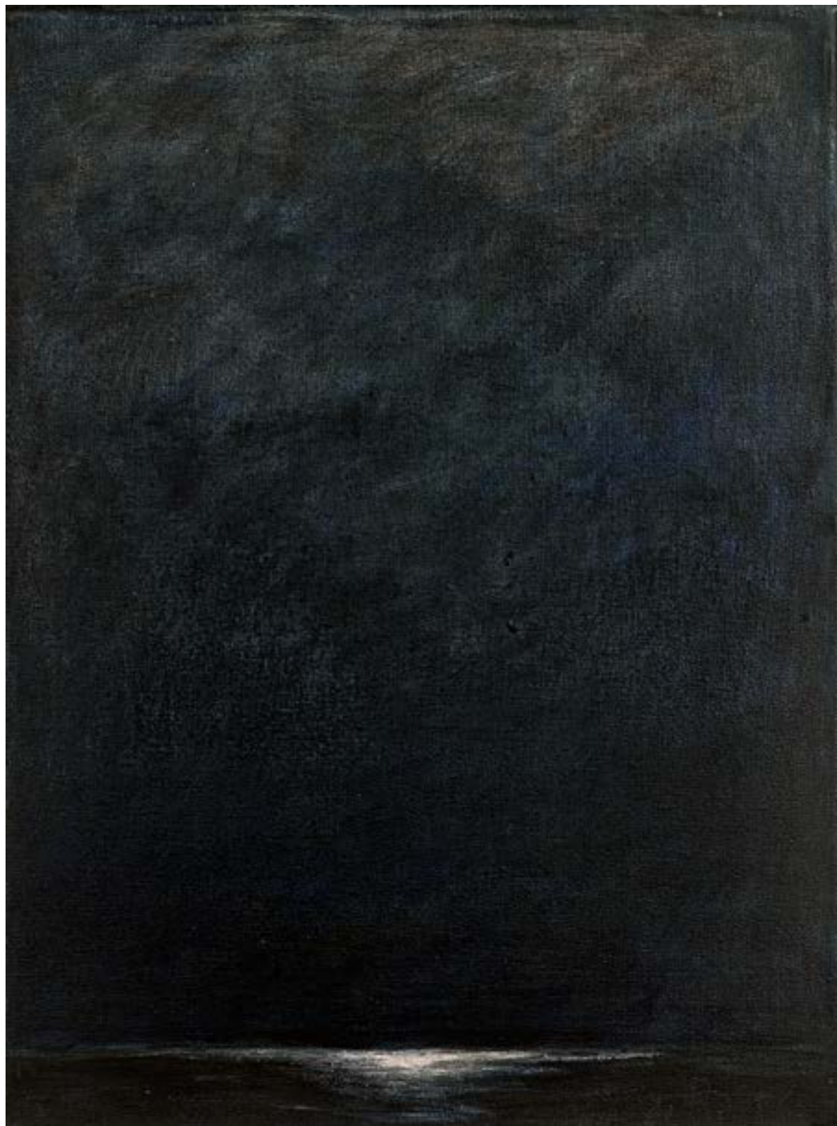
Migrante Técnica mixta sobre tela y cartón 66x50 cm