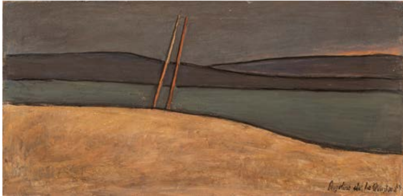
Mástiles Óleo sobre tela 38,5x80cm