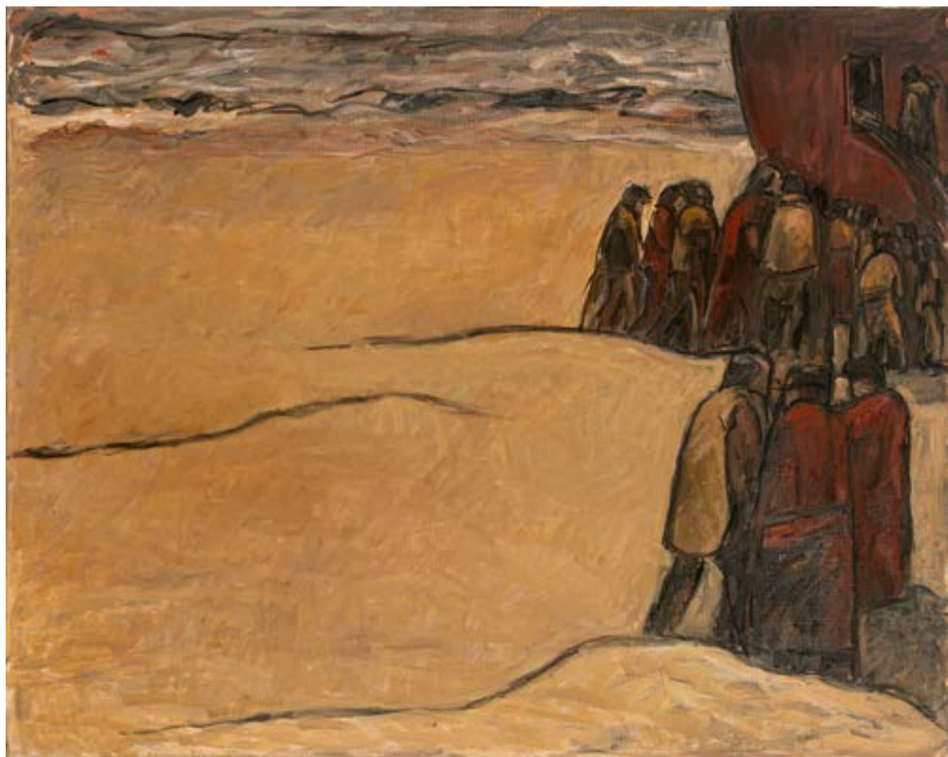
Esperanza Óleo sobre tela 80x100 cm