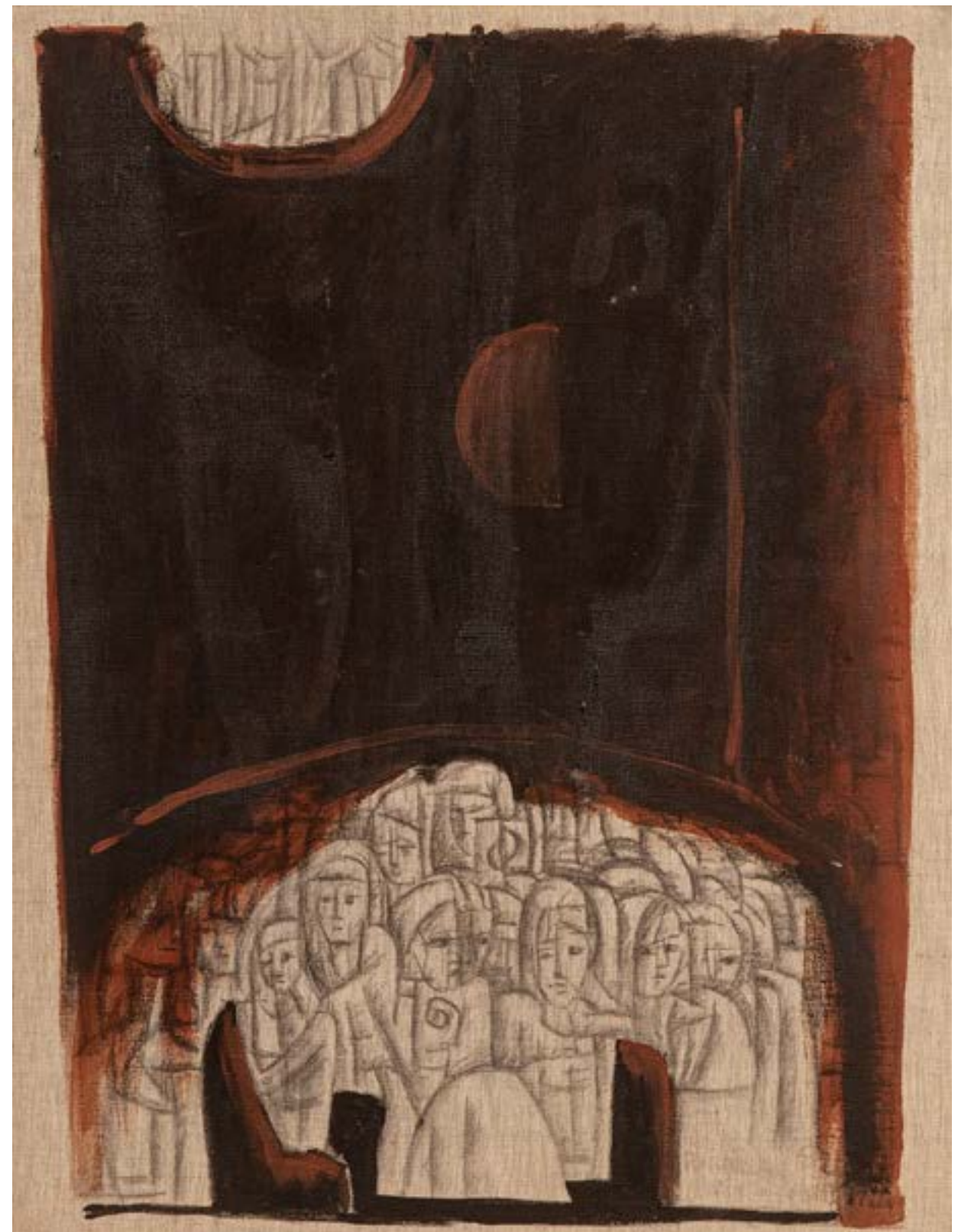
Migrantes Técnica mixta sobre tela y cartón 66x50 cm