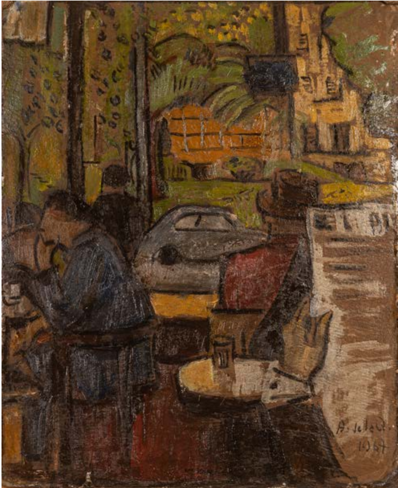
Café Sorocabana Óleo sobre cartón 70x50 cm