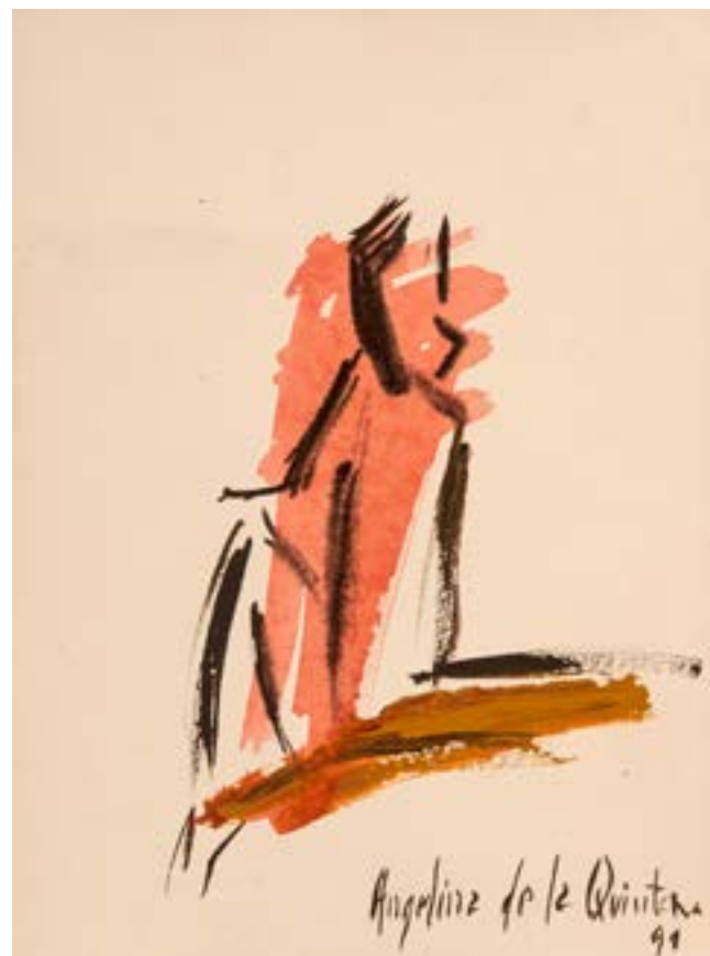
Mujer Acrílico sobre papel 40x30cm