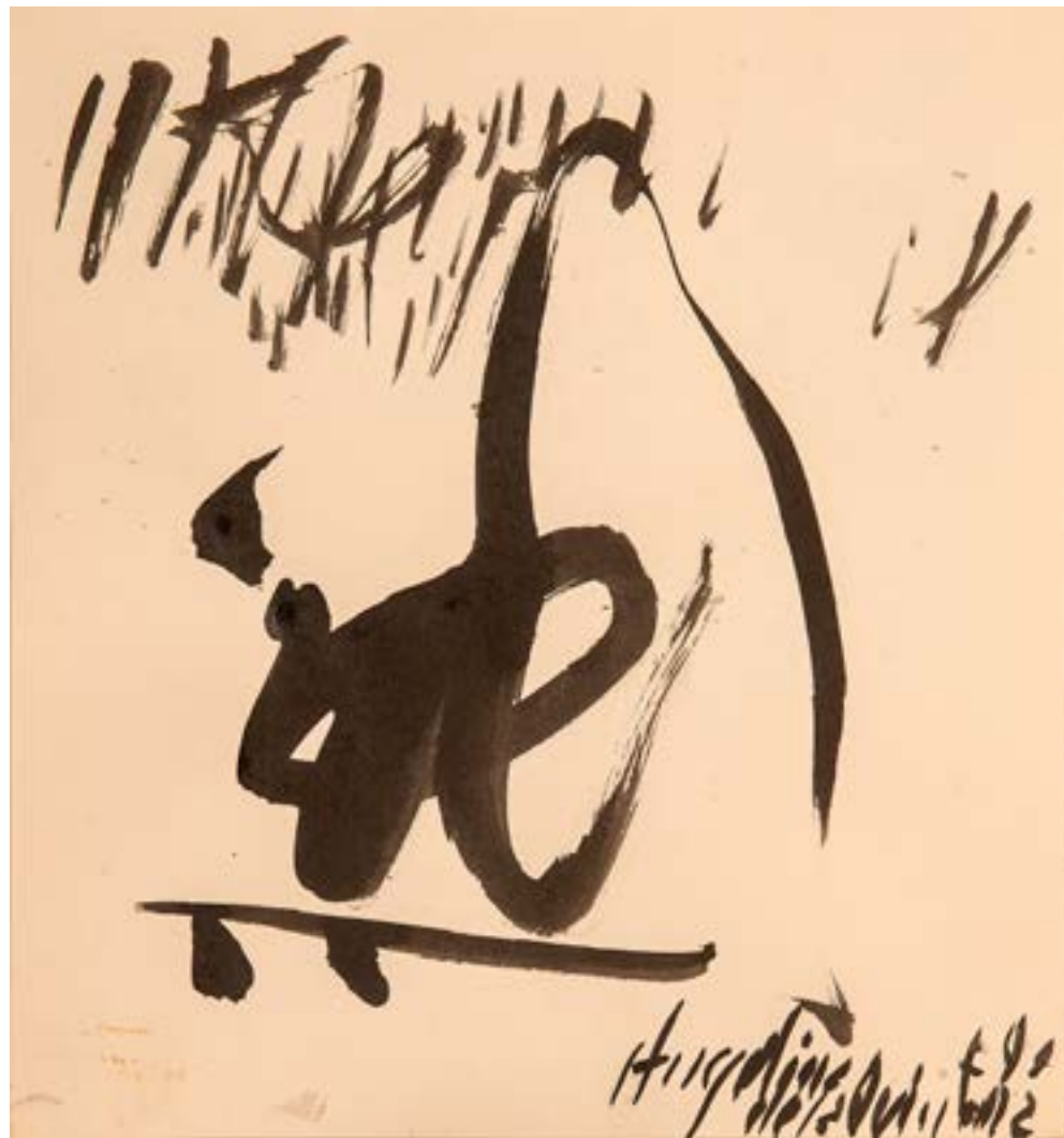
Sin título Tinta sobre papel 21,5x20cm