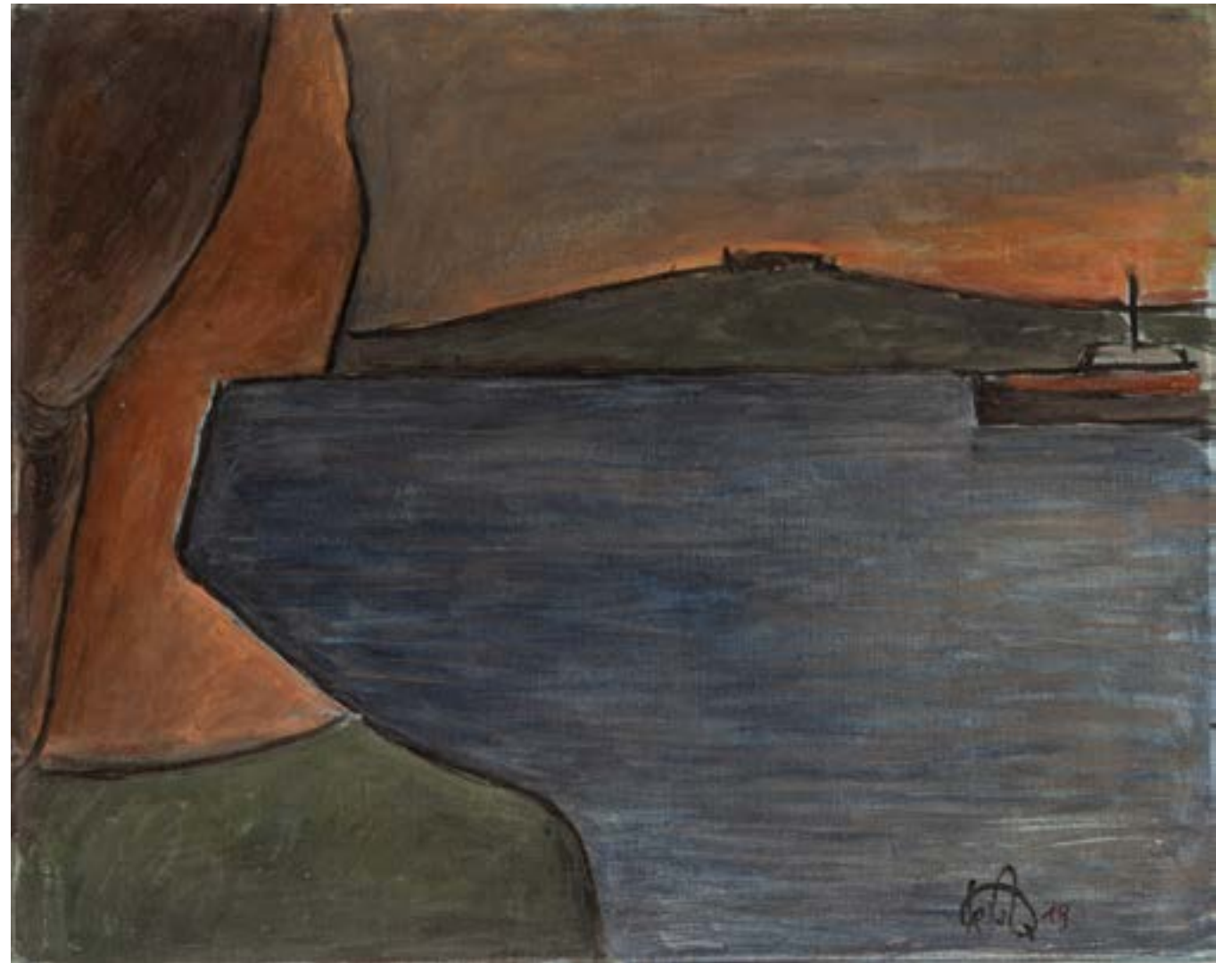
Mirando al Cerro Óleo sobre lienzo 50x40 cm