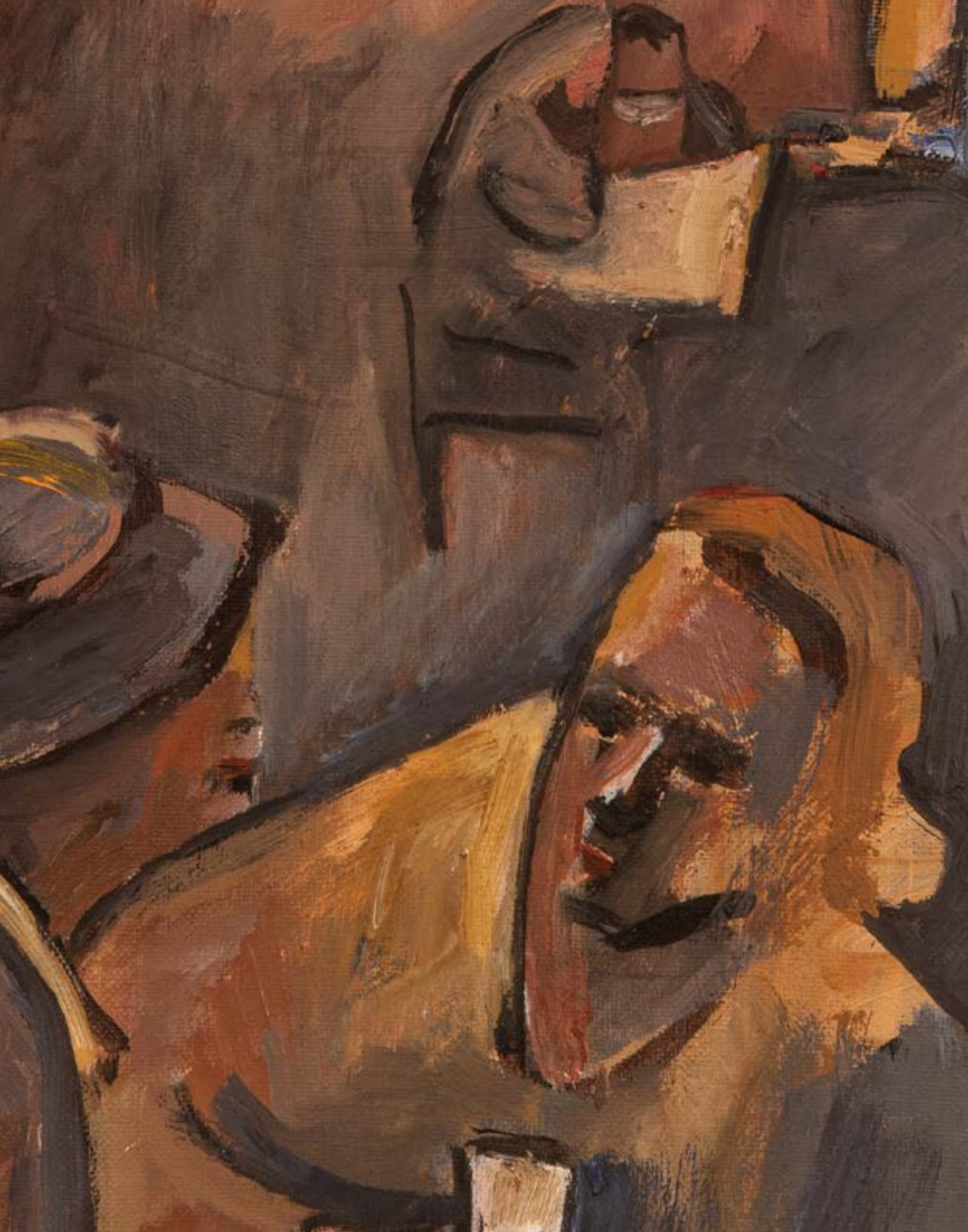
Conversando Óleo sobre cartón 34,5x26 cm