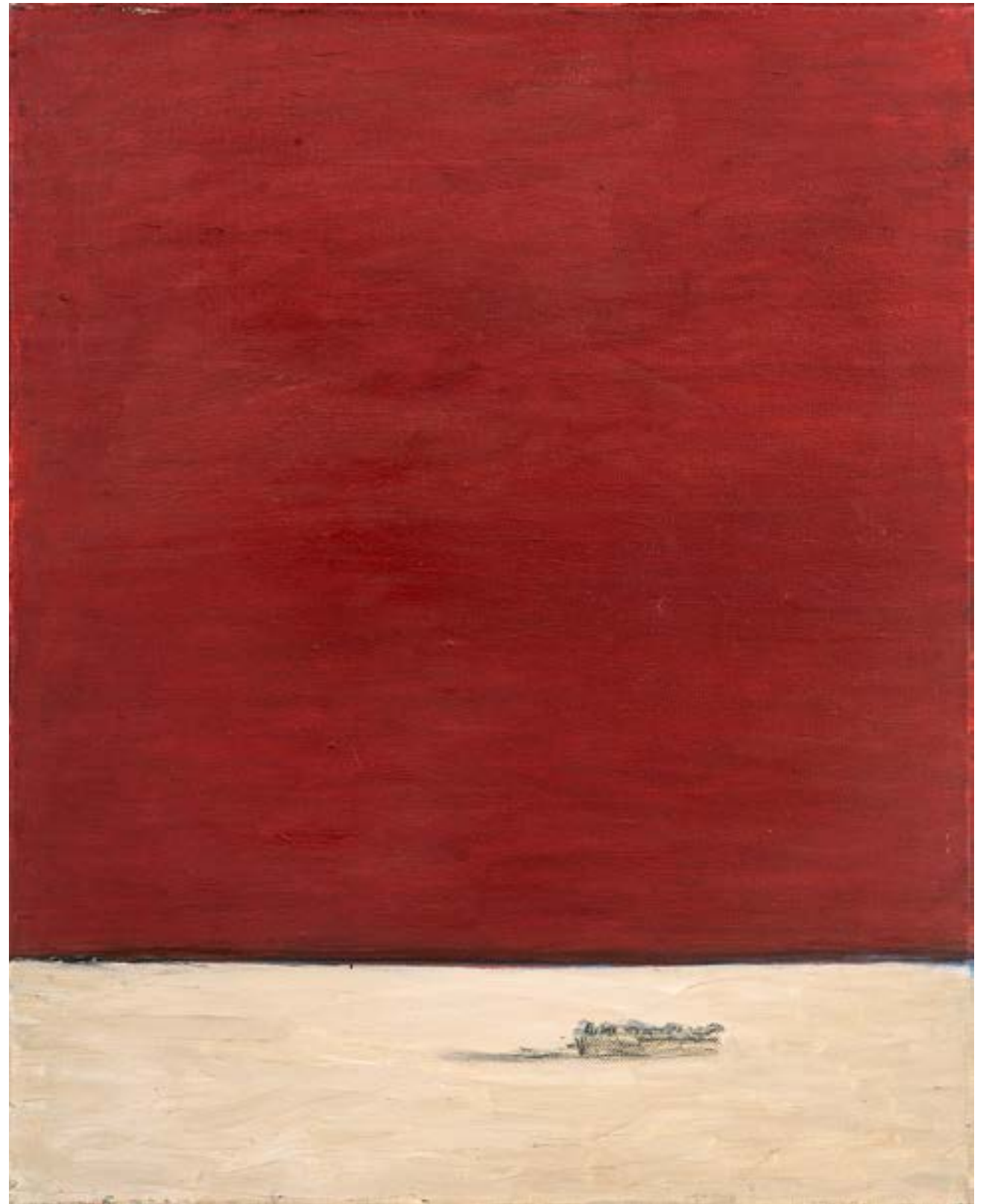
Cielo rojo Óleo sobre tela 50x40 cm