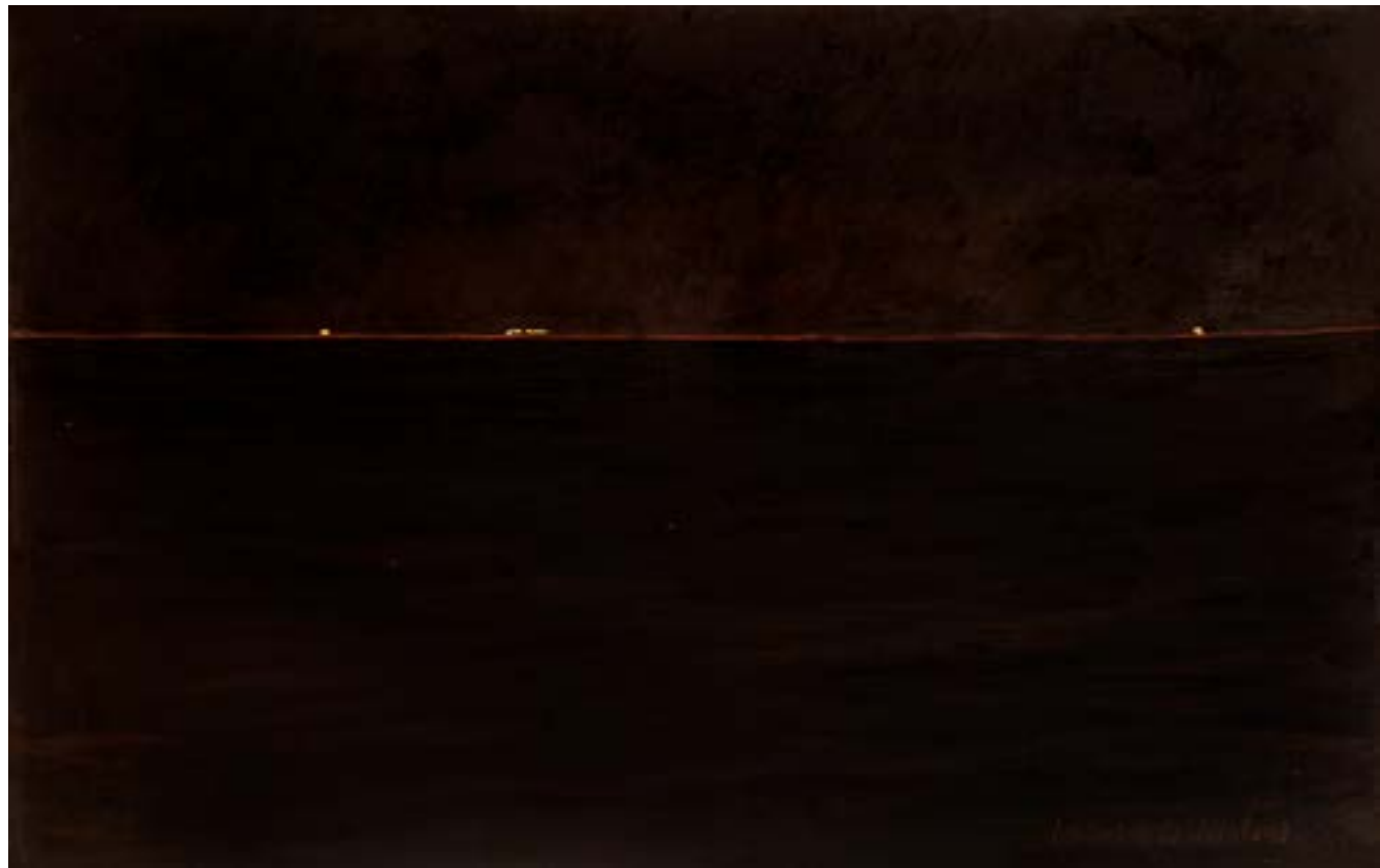
Horizonte naranja Óleo sobre cartón 35x50 cm