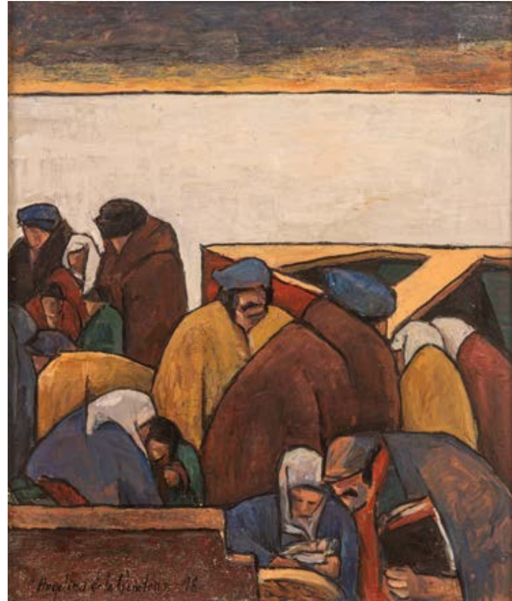
Homenaje a Barradas I Óleo sobre cartón 66x50 cm