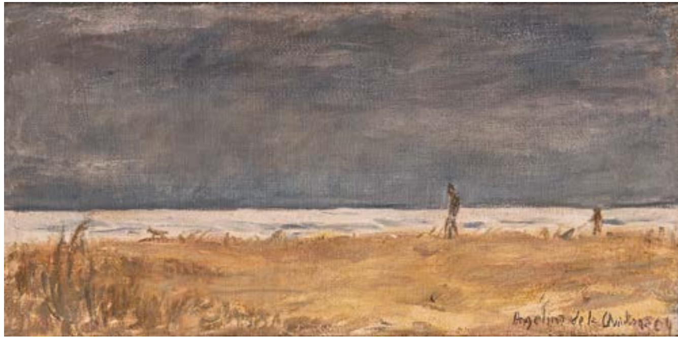
Playa Óleo sobre tela 38,5x80 cm