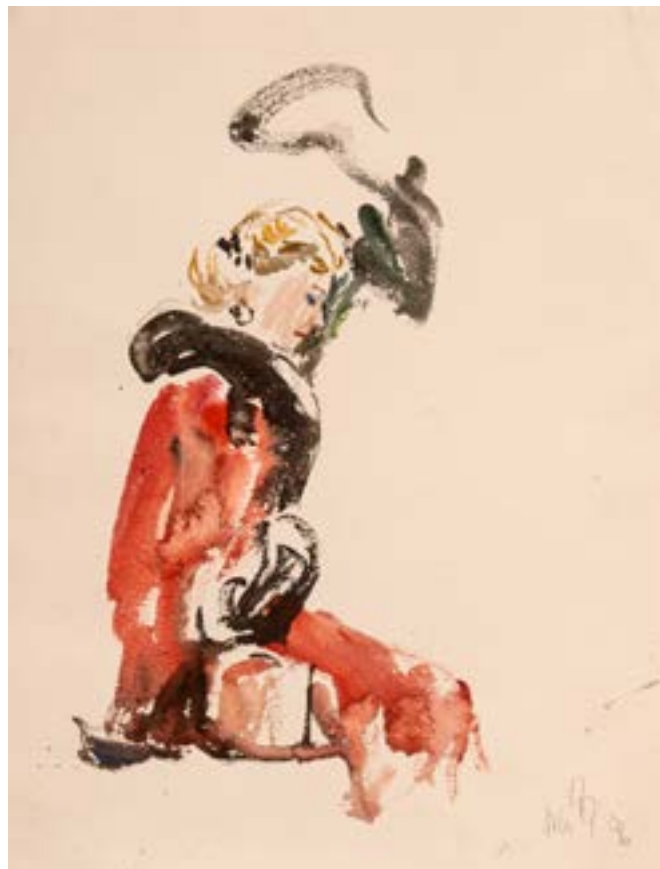
Mujer de rojo Acrílico sobre papel 40x30cm